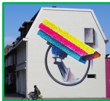
Super A.

Zo divers als Rotterdam is, zo divers zijn de street art kunstenaars uit verschillende wijken. Door hun verschillen versterken zij ook het DNA van hun specifieke wijk. Zij hebben hun eigen stijl en invloeden, wat bijdraagt aan een lokale identiteit waar Rotterdammers trots op kunnen zijn!