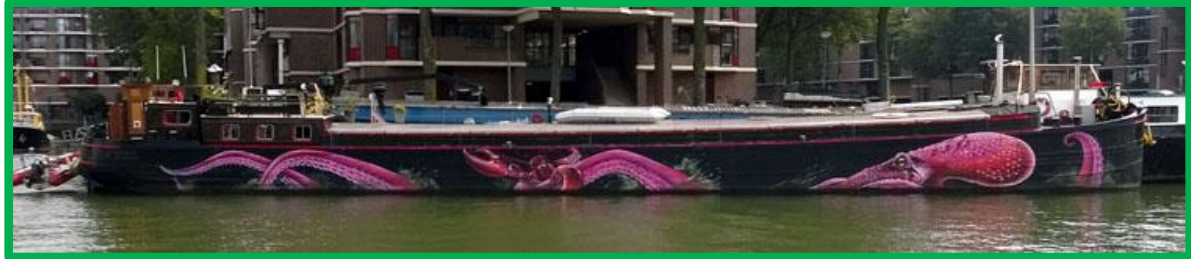
Kunstenaars Vinz en Dopie.

Street art hoeft zich echter niet te beperken tot muurschilderingen. Allerlei objecten in de openbare ruimte kunnen gebruikt worden. Het duidelijkste voorbeeld daarvan is misschien wel "het monster van Rotterdam", oftewel, de octopus schildering op een schip in de Leuvenhaven.