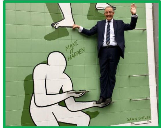
Daan Botlek ©PortofRotterdam

In de jaren '80 en '90 liep Rotterdam nog voorop, maar sindsdien is er een zeer restrictief beleid gevoerd. Pas sinds de motie 'Ruimte voor Graffiti' van GroenLinks en Nida in 2015 werd aangenomen in de gemeenteraad, lijkt er weer wat meer positieve aandacht vanuit het bestuur te komen voor street art. De motie roept tot het plaatsen van legale graffiti-muren. Dit, samen met het wijkveiligheidsactieprogramma waarin men street art gebruikt om wijken op te knappen, doet het tij gelukkig enigszins keren. Langzaam maar zeker lijken we ons in Rotterdam te realiseren dat street art van grote waarde voor de stad is en perfect bij Rotterdam past: hip, rauw, cultureel, creatief en niet elitair.