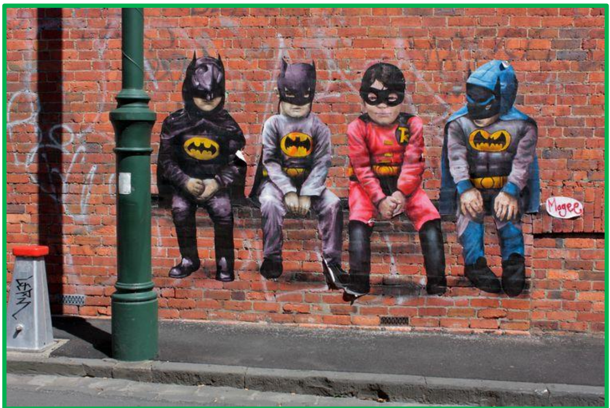
Fintan Magee.