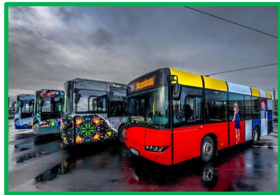
Diverse kunstenaars

Daarnaast zijn er oneindig veel objecten in de openbare ruimte waar kunstenaars hun creativiteit op los kunnen laten. Ieder object kan worden omgetoverd tot een kunstwerk dat gelijktijdig de openbare ruimte verbetert. In Rotterdam zijn bijvoorbeeld veel gevellijsten te vinden die hier van zouden opknappen zoals recentelijk op Katendrecht is gedaan. Maar er valt ook te denken aan stoepen, putten, hekjes, bouwhekken, elektriciteitshuisjes en kastjes, bushaltes, metrobanen, bankjes, prullenbakken, etc. Bijna alles kan dienen als basis voor kunst en de gehele openbare ruimte zou een groot openlucht museum kunnen zijn.