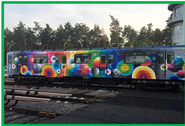
Kunstenaar Okuda San Miguel.

Een ander mooi voorbeeld zijn de bussen in Stavanger, Noorwegen. Het lokale openbaar vervoerbedrijf heeft kunstenaars van over de hele wereld aangetrokken om de bussen door middel van street art te versieren. De bussen zijn daarmee rijdende kunstobjecten geworden. Het zelfde geldt voor metrostellen in Kiev, Oekraïne. Eigenlijk zoals de beweging ooit illegaal is begonnen, erkent en gebruikt men nu de toegevoegde waarde voor de stad op de voertuigen.